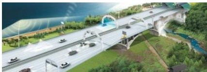
〈 도로 및 도로의 부속물 〉