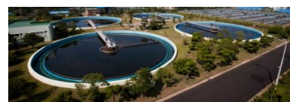
〈 공공폐수처리시설 〉