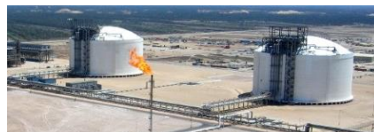
〈 가스공급시설 〉