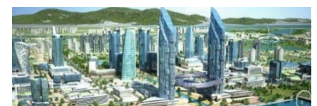
〈 스마트도시기반시설 〉