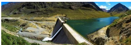
〈 신·재생에너지설비 〉