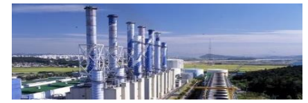
〈 전원설비 〉