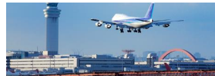
〈 공항시설 〉