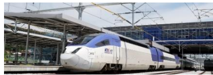
〈 철도 및 도시철도 〉