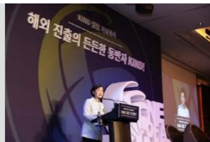
◀ KIND 창립기념식 (2018.6.27)